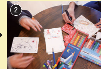
2 くじに書かれたことばを絵にします。