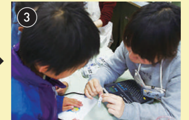
3 描けたら、くじのことばのテプラシールを作ります。