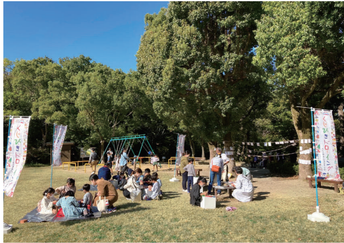
浜松城公園 / 2022年