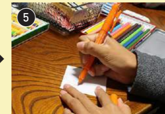
5 次のくじの言葉を考えます。