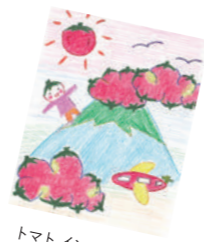
トマトインザスカイ